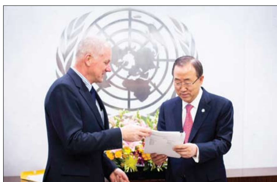
باكي مون يتسلم تقرير الحقيقين الذي يؤكد استخدام الاسلحة الكيماوية في مواقع سورية

•• عواصم - وكالات: استمرت الاشتباكات بين قوات النظام وكتائب المعارضة في أنحاء متفرقة من سوريا. في وقت أعلن فيه الجيش السوري الحر سيطرته على بلدة عدرا في ريف دمشق وعلى مناطق أخرى في ريف درعا. وأفاد المرصد السوري لحقوق الإنسان بسقوط قتلى نتيجة قصف القوات النظامية مناطق في بلدة سحم الجولان في ريف القنيطرة بينهم مقاتل وطفلان، كما أفاد المرصد عن سقوط قذائف عدة على مناطق في محيط ساحة الأمويين في وسط العاصمة دمشق. يأتي هذا في وقت تواصلت فيه الاشتباكات في القوطة الشرقية قرب دمشق. واستمر القتال في محيط عدرا بريف دمشق بعد يوم من اشتباكات عنيفة قتل فيها ما يقرب من عشرين من الجنود النظاميين وجيش الدفاع الوطني فضلاً عن عدد من مقاتلي المعارضة. وتشهد المدينة حركة نزوح بسبب القصف والغارات الجوية المكثفة التي تعرضت لها، مما أدى إلى