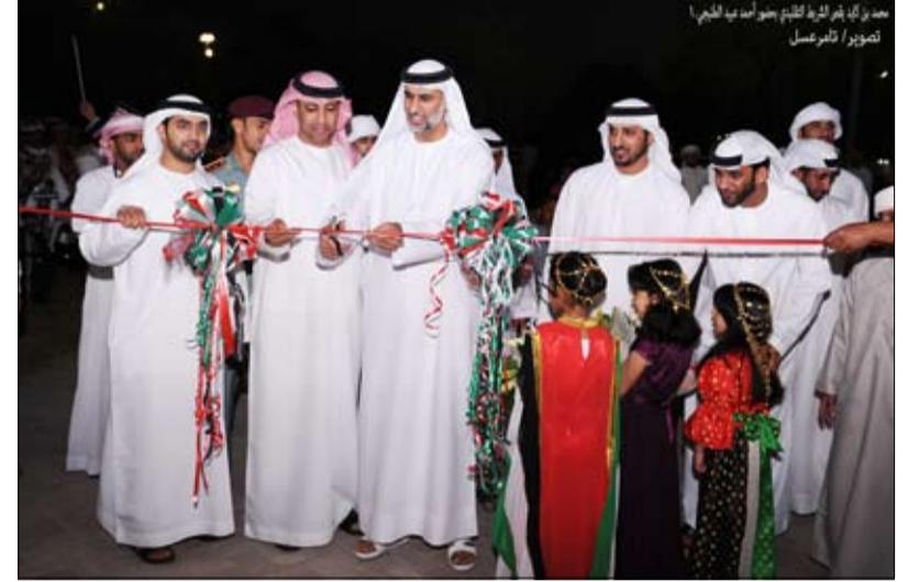
محمد بن كايد يقص الشريط التقليدي للقرية التراثية