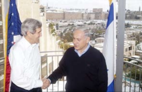
كيري خلال لقائه مع نتتياهو

•• القدس المحتلة - وكالات: اعلن وزير الخارجية الاميريكي جون كيري الجمعة انه من الممكن التوفيق بين تطلمات اسرائيل الى الامن ورغبة الفلسطينيين بالسيادة وذلك خلال مهلة التسعة الايام. وقال كيري في تصريح صحافي ادلى به في تل ابيب قبيل مغادرته اسرائيل في ختام زيارة جديدة الى الشرق الاوسط "نعمل على مقاربة تضمن امن اسرائيل مع الاحترام الكامل لسيادة الفلسطينيين. وقالت صحيفة هآرتس الاسرائيلية ان وزير الخارجية الاميريكي جون كيري يحاول ان يدفع نحو التوصل الى اتفاق اطار بين الفلسطينيين والاسرائيليين بهدف إنقاذ العملية السلمية بعد أكثر من 20 اجتماعا بلا نتائج مهمة. وكان الرئيس الفلسطيني محمود عباس التقى بالوزير