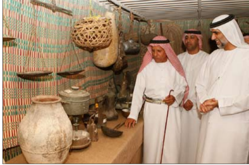
نائب رئيس اللجنة العليا المنظمة للمهرجان يتجول في القرية