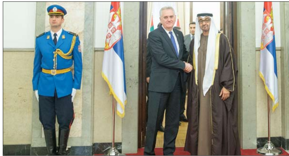
محمد بن زايد خلال لقائه مع الرئيس الصربي في بلجراد

•• بلجراد - وام: بحث الفريق أول سمو الشيخ محمد بن زايد آل نهيان ولي عهد أبو ظبي نائب القائد الأعلى للقوات المسلحة مع فخامة توميسلاف نيكوليتش رئيس جمهورية صربيا العلاقات الثنائية بين دولة الإمارات العربية المتحدة وجمهورية صربيا وسبل تطويرها بما يخدم المصالح المشتركة للبلدين والصديقين. جاء ذلك خلال استقبال الرئيس الصربي امس بمقر الرئاسة في بلجراد سمو الشيخ محمد بن زايد آل نهيان والوفد المرافق الذي يقوم بزيارة لجمهورية صربيا. ورحب الرئيس الصربي بالفريق أول سمو الشيخ محمد بن زايد آل نهيان وأعضاء الوفد المرافق له معرباً عن سعادته بالزيارة والبحث مع سموه في سبل تعزيز العلاقات الثنائية بين البلدين الصديقين. ونقل الفريق أول سمو الشيخ محمد بن زايد آل نهيان للرئيس الصربي خلال اللقاء تحيات صاحب السمو الشيخ خليفة بن زايد آل نهيان رئيس الدولة حفظه الله وتمنياته لصربيا وشعبها الصديق المزيد من التقدم والنماء والازدهار. وأعرب سموه عن سعادته ببقاء رئيس جمهورية صربيا والتحدث معه حول مجمل العلاقات بين البلدين وأهم الخطوات الرئيسية لتنمية وتطوير المجالات المختلفة من أجل المزيد من النمو والتقدم.. مشيراً سموه إلى أن العلاقات بين دولة الإمارات وصربيا تشهد تطوراً في كافة المجالات وهي تأتي في إطار الصداقة والتعاون والمصالح المشتركة.