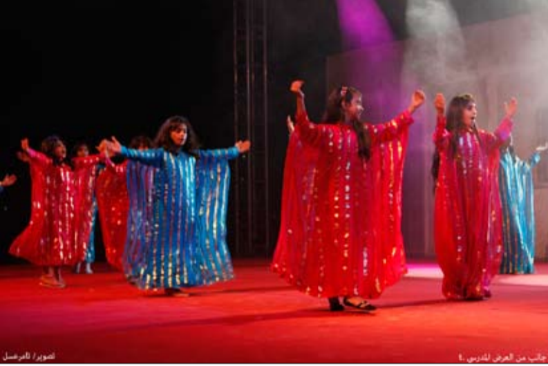
طالبات مدارس يقدمن عرضا فنيا في الافتتاح